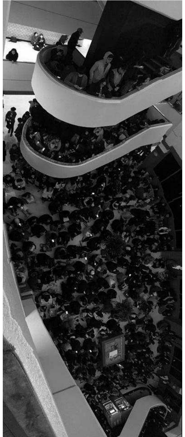
3월 31일 행정관을 가득 메운 학생들

학교가 대학 평가에서 등급을 높게 받으려고 한 구조조정이나 학생들을 위한 것이라고 말하는 것은 거짓말입니다. 학생들이 이토록 반대하는데 도대체 누구를 위한 평가이고, 개혁인 것인지 묻지 않을 수 없습니다.