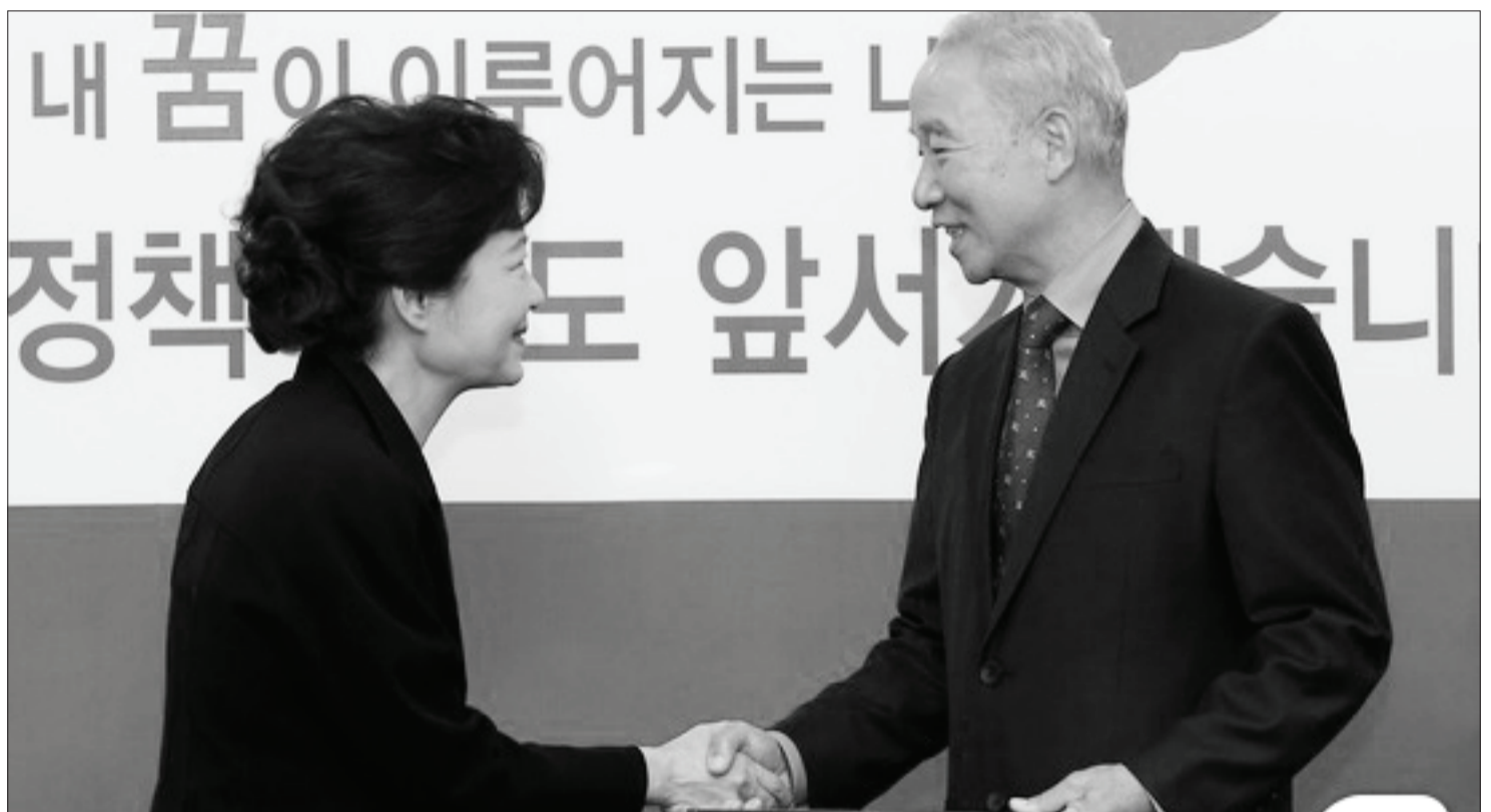
손 잡은 박근혜와 남재준 - 민주주의의 시계를 거꾸로 돌리려는 공모자들

박근혜는 이런 마녀사냥을 연막 삼아 기초노령연금 등 복지 공약을 대량 '먹튀'할 수 있었다. 박근혜는 경제위기 시기에 재벌들의 뒤를 봐주기 위해 앞으로 더 많은 공약 뒤집기를 밀어붙일 것이다. 이 때문에 진보 진영과 운동을 억누르기 위한 노골적인 반동 정책 또한 계속 시도될 것이다